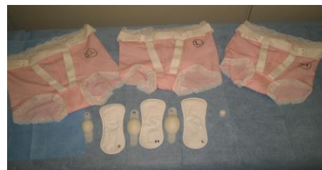
フェミクッション