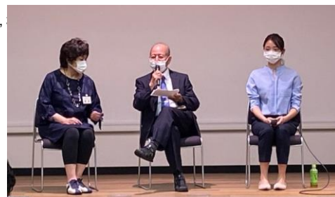
セミナー最後のQ&Aにはたくさんの質問が!