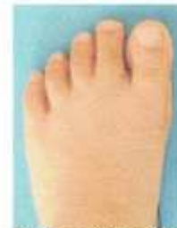
スクウェア(方形型)