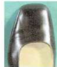
スクウェア(フレンチ)