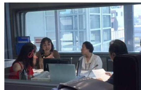
オンエア中の稲垣会長